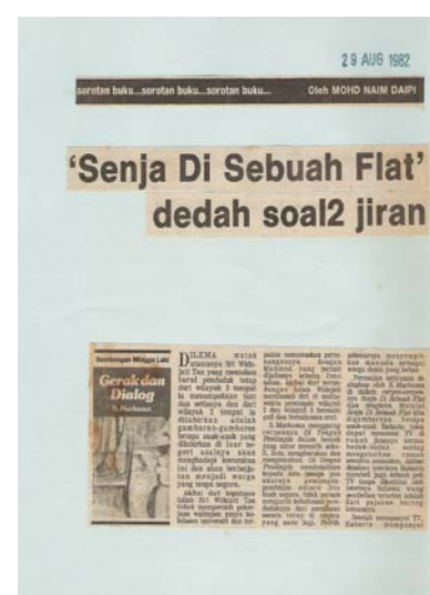
Makalah ini pernah tersiar di akhbar Berita Minggu pada 15, 22 dan 29 Ogos 1982