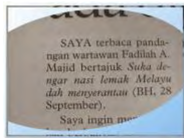
Saya terbaca pandangan wartawan Fadilah A. Majid bertajuk Suka Dengar Nasi Lemak Melayu dah Menyerantau .

Setujukah anda dengan penggunaan menyerantau dalam konteks tersebut? Apakah pandangan anda, jika kita menggantikannya dengan merantau sahaja atau menyejagat ( meN + [ se + jagat] )?