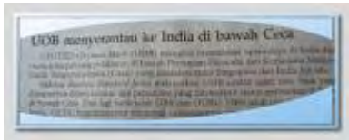
UOB menyerantau ke India.