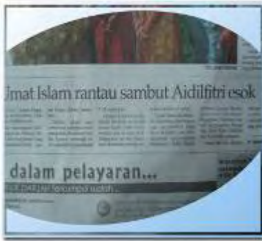
Umat Islam rantau sambut Aidilfitri esok.

Dalam petikan 1, tajuk berita ini menjadi rancu lantaran tidak menggunakan awalan se . Seharusnya tajuk yang baku ialah: 1) Umat Islam Serantau Menyambut Aidilfitri, Esok.